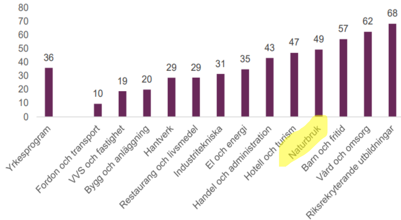
Diagram 13. Andel (procent) elever med yrkesexamen våren 2022 som har grundläggande behörighet till högskoleutbildning redovisade per yrkesprogram.